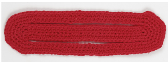
Bild av den färdiga röda sidan