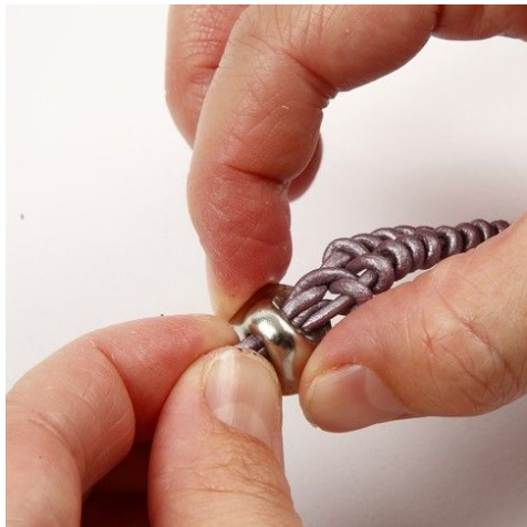
9. Trä knappen på plats.