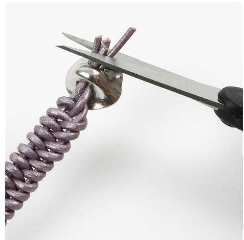
10. Klipp av ändarna.