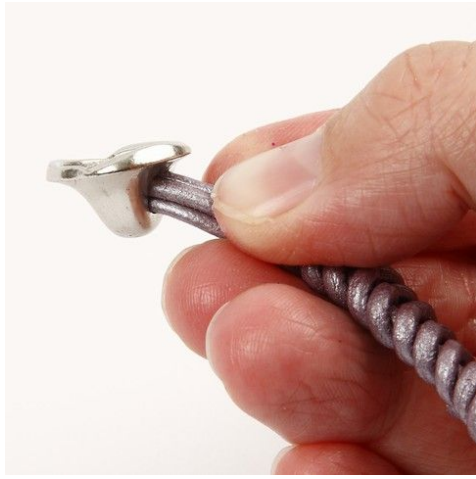
7. Knytknappen träs över de fyra ändarna.