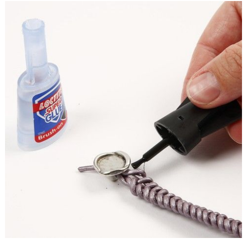
8. Pensla med lim, där knappen ska sitta.