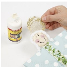
Limma glorian bakpå ängels huvud med hobbylim.