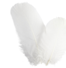
Runda fjädrar, gås, ca. 8 cm, vit, 3g 51816