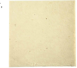
Handgjort papper, 20x20 cm, 70 g, off-white, 50ark 22035