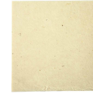
Handgjort papper, 20x20 cm, 70 g, off-white, 10ark 220350