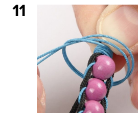
11 Gör en knut för att avsluta.