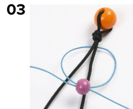
03 Ett tunt knyt-snöre förs bakom den tjocka tråden och de två ändarna förs från varsin sida genom en liten pärla.