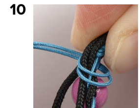
10 Det tunna snöret viras runt för att göra en ögla.