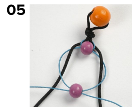
05 Den tunna änden förs igenom en liten pärla.