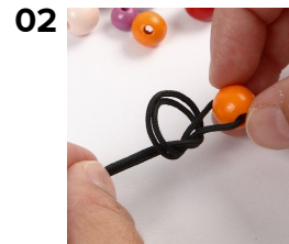
02 Knyt en knut tätt på pärlan.