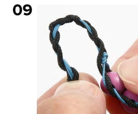
09 Det flätade stycket viks runt till en ögla - tillräckligt stor för den stora pärlan.