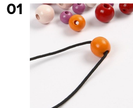
01 En stor träpärla träs på det tjocka knyt-snöret.