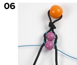
06 Det tjocka snöret läggs över det tunna, fortsätt på detta sätt, till en passad längd.