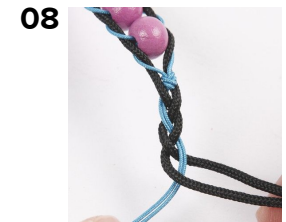
08 Fläta en liten bit med ändarna.