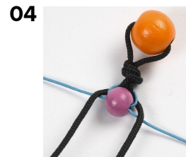
04 De två tjocka snörena läggs nu över den tunna.