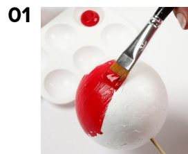
01 Frigoliten målas med Plus Color hobbyfärg. Låt torka.

Roliga julkulor av frigolit viras med Fantasy akrylgarn, dekorerar med målade blomsterpinnar och knappar.