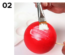
02 Stryk på Klæberfix lim.