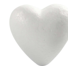
Hjärtan, H: 8 cm, vit, frigolit, 50st. 543542