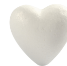
Hjärtan, H: 8 cm, vit, frigolit, 5st. 543541