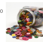
Knappmix, dia. 12+18+20 mm, mixade färger, 800st. 40381