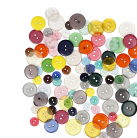
Knappmix, dia. 12+18+20 mm, 100 g, mixade färger, 100st. 403810