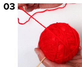
03 Vira på garn.