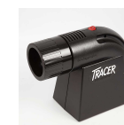
Projektor, , 1st. 14060