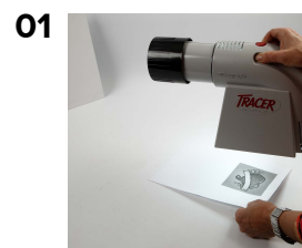
01 En bild på max 13x13 förstoras med projektor på en vägg.

Här har en projektor fått förstora foton till dubbel storlek. Projektionen har skissats upp på en målarplatta med permanent tusch och målats med Pigment akrylfärg.