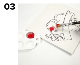
03 Måla med permanent akrylfärg.