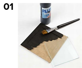
Måla träramarna med Plus Color

De färgstrålade grytunderläggen är målade med Plus Color svart. Riv bitar i neonpapper och fäst i ramen med limstift och dekorera med tusch och Plus Color. Glasplattorna är fastlimmade med limpistol i hörnen.