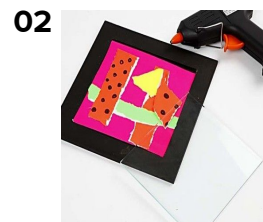
Lägg bitar av rivet neonpapper och neonkartong och limma fast med limstift. Teckna eventuellt med tusch eller Plus Color. Limma fast glasplattan i träramen med limpistol i varje hörn.