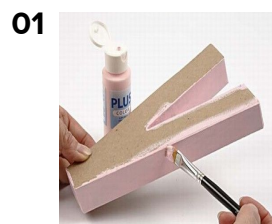
01 Bokstäverna målas på de tre sidor som inte ska bekläs med papper.

Målade med Plus Color och sedan dekorerade med Vivi Gade Design paper. Limmade och decouperade med decoupageglack. Dekorerade med band.