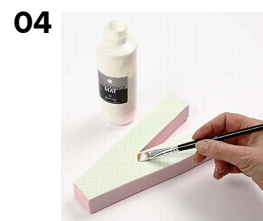
04 Lackera pappret.