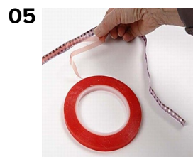
05 Sätt powertape på bandet.