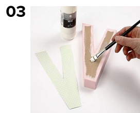
03 Pensla bokstaven med decoupageglack och limma fast pappret.