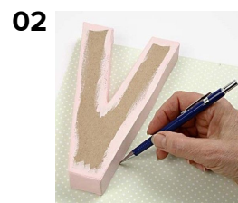
02 Måla av bokstaven på pappret och klipp ut.