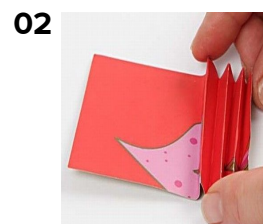
02 Vik Vivi Gade-papper som ett dragspel och limma fast på ikonplattan med limpistol.