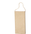
Ikonplatta, stl. 14x6,5x1,4 cm, 1st. 26750