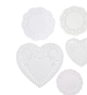
Tårtapper, stl. 9-14,5 cm, 400st. 20981