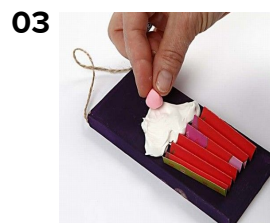
03 Placera lite strukturstampa i en plastpåse och pressa ned i ett av påsens hörn. Klipp ett litet hål i påsens spets. Nu kan pastan pressas ut så den ser ut som vispad grädde eller glasyr. Avsluta eventuellt med några dekorationer formade i Silk Clay.