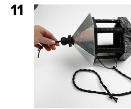
Trä snöret genom hålet, använd hjälpsnöret.