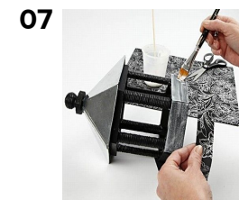
Klipp papperstrimlor 50x2,7cm och limma på med Paverpol.