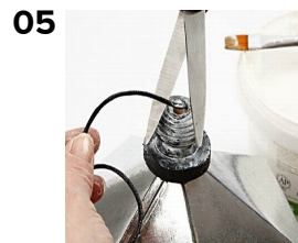
Klipp av änden