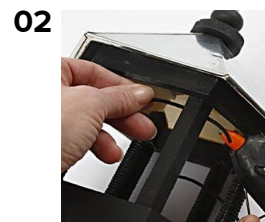
Klipp bomullsnöre: 6 x1,5 m till stolparna, 1 meter till knoppen och 4 meter i ett stycke till upphängning. Limma fast bomullsnören med limpistol på stolpen. Vira bomullsnöret (1,5m) runt stolpen, applicera Paverpol lim på stolparna, efterhand som du virar fast bomullsnöret. Ändarna limmas fast med