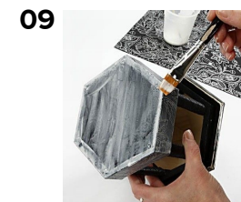
Lacka med Paverpol limmet i botten och på pappret.