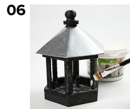
Lacka huset med Paverpol lim.