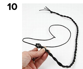
Ta de 4 m långa bomullsnörena. Lägg dem dubbelt och vira stramt. Lägg det dubbelt, knyt ihop ändarna. Klipp en bit hjälpsnöre, trä genom det som surrats.