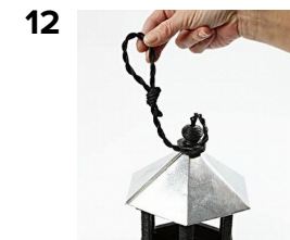
Knyt en ögla till upphängning, klipp av ändarna snyggt.