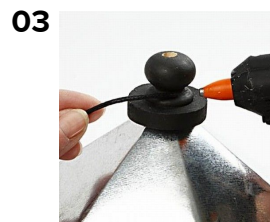
Limma fast bomullsnöre på knoppen med limpistol.