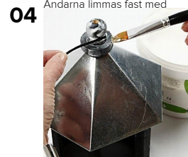
Lägg på Paverpol lim och vira runt.