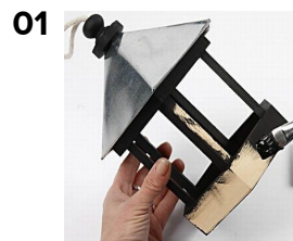
Måla huset med Plus Color.

Fågelbord målat med Plus Color och decouperat med handgjort papper. Hela huset är lackerat med Paverpol skulpturlim, som förbättrar hållbarheten vid utomhusbruk.